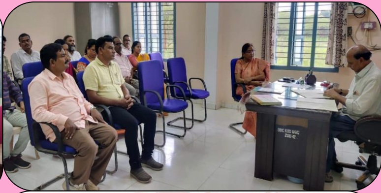
రైల్వే కోడూరు ప్రభుత్వ డిగ్రీ కళాశాల ను సందర్శించిన కడప ప్రాంతీయ సంయుక్త సంచాలకులు